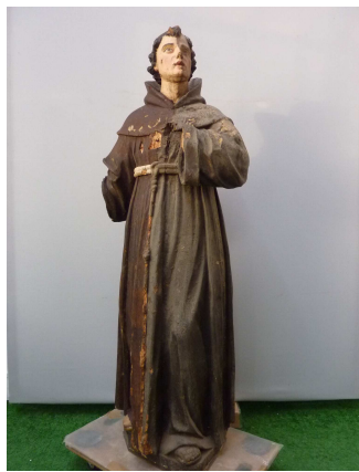
En cours de restauration