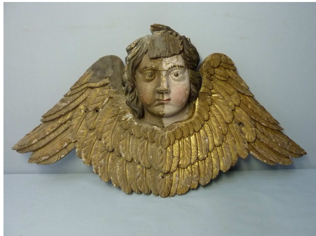
En cours de restauration