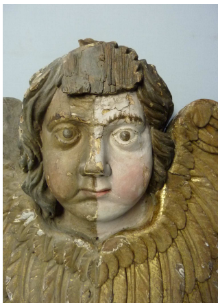
En cours de restauration